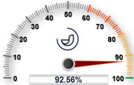
Seguridad ciudadana, justicia y estado de derecho