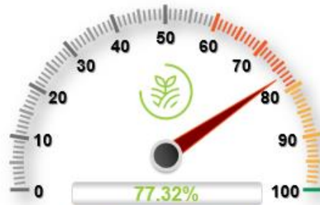
Desarrollo sostenible del territorio