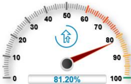
Desarrollo y crecimiento económico