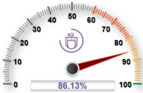
Gobierno efectivo e integridad pública